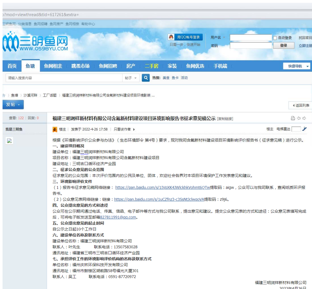
图3-2-1 征求意见稿公示网页截图