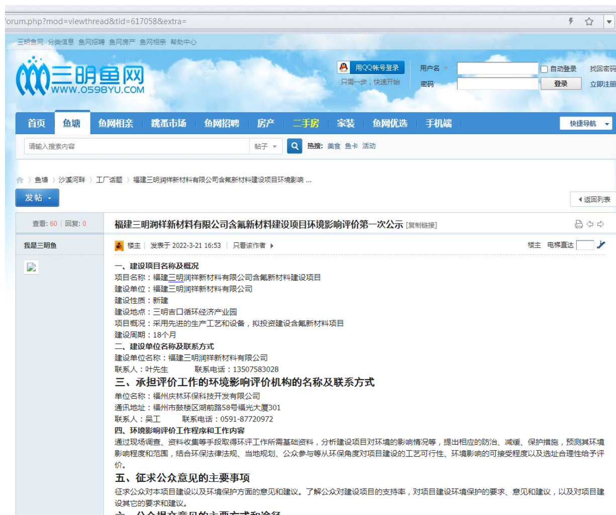
图2-2-1 首次公示网页截图

首次公示在三明鱼网进行网络公示，公示网址为： http://bbs.0598yu.com/forum.php?mod=viewthread&tid=617058&extra= ，公示截图 见图2-2-1。