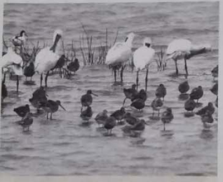
福建省湿地保护宣传周活动启动

《中国共产党百年法治大事记》共分4个分册,1294页,22万字,以党的百年法治史为主线,以党的百年法治理论、法治实践、法治文化、法治保障为主线,系统梳理了党的百年法治史,生动鲜活、可读性强。