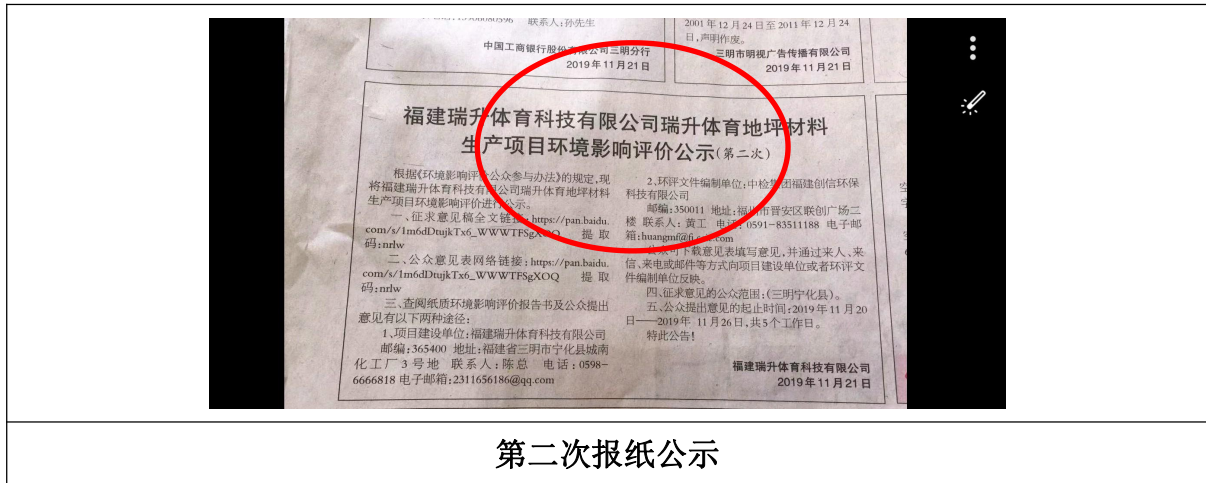
图 3-2 登报公示截图