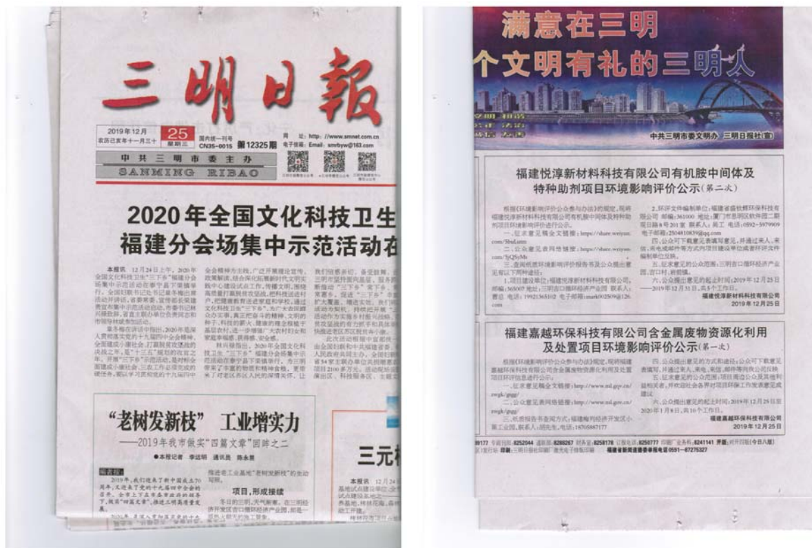
图 3-2-2 三明日报 2019 年 12 月 25 日公告

公司分别在 2019 年 12 月 25 日的《三明日报》（第 12325，B4 版）和 2019 年 12 月 29 日的《三明日报》（第 12329，A4 版）发布项目环境影响报告书征求意见稿公示公告，详见图 3-2-2、3-2-3。