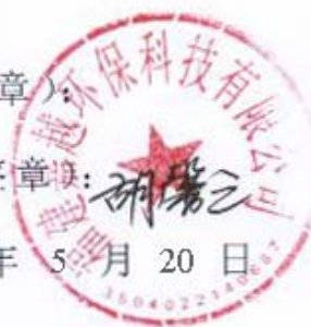
图 2-1-1 项目环境影响评价委托书