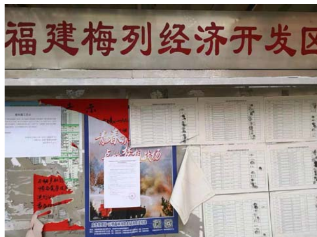
小蕉工业园管委会公告栏公告近景