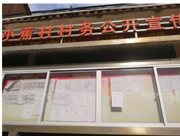
小蕉村公告栏公告远景