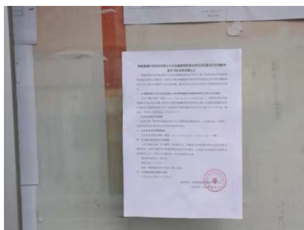
小蕉村公告栏公告近景