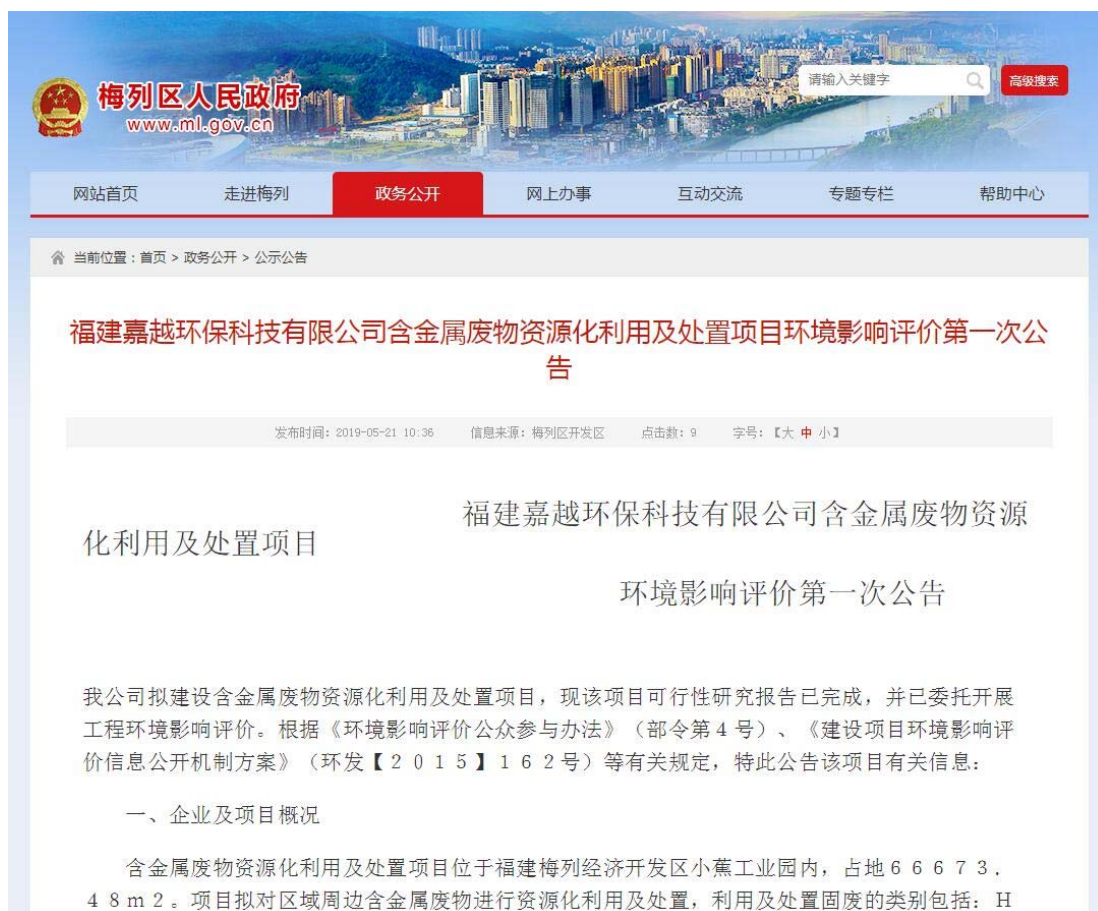
图 2-1-2 首次环境影响评价信息网络公开截图

首次环境影响评价信息公开在梅列区人民政府网上进行，公示起始时间为 2019 年 5 月 21 日至 2019 年 6 月 3 日，首次环境影响评价信息公开公告登入网址： http://www.ml.gov.cn/zwgk/gsgg/201905/t20190521_1300964.htm ，截图见图 2-1-2。