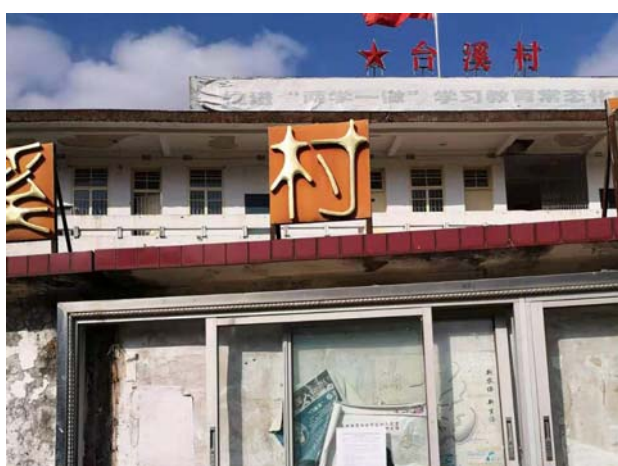
台溪村公告栏公告远景