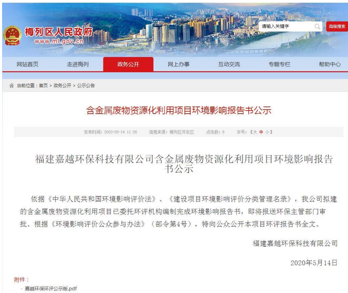
图 6-1-1 环境影响报告书报批前网络公示截图

项目环评报告于 2020 年 5 月 14 日在梅列区人民政府网 ( http://www.ml.gov.cn/zwgk/gsgg/202005/t20200514_1530378.htm ) 进行了环评报批前全文公示 (公示截图见图 6-1-1), 公示内容为《含金属废物资源化利用项目环境影响报告书 (报批本)》全本 (未包含国家秘密、商业秘密、个人隐私等依法不应公开内容)。