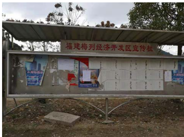
小蕉工业园管委会公告栏公告远景