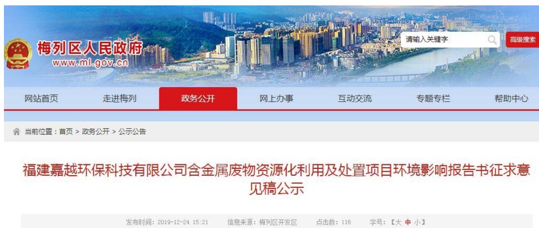
图 3-2-1 环境影响报告书征求意见稿网络公示截图

项目环境影响报告书征求意见稿公示在梅列区人民政府网上进行, 公示起始时间为 2019 年 12 月 25 日至 2020 年 1 月 8 日, 环境影响报告书征求意见稿公示登入网址: http://www.ml.gov.cn/zwgk/gsgg/201912/t20191224_1458888.htm , 截图见图 3-2-1。