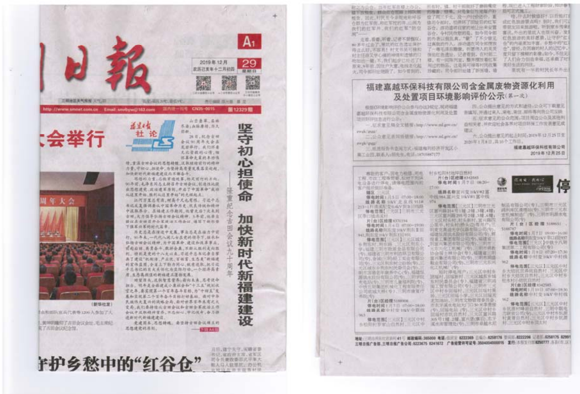
图 3-2-3 三明日报 2019 年 12 月 29 日公告