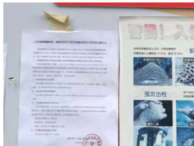
管前村公告栏公告近景