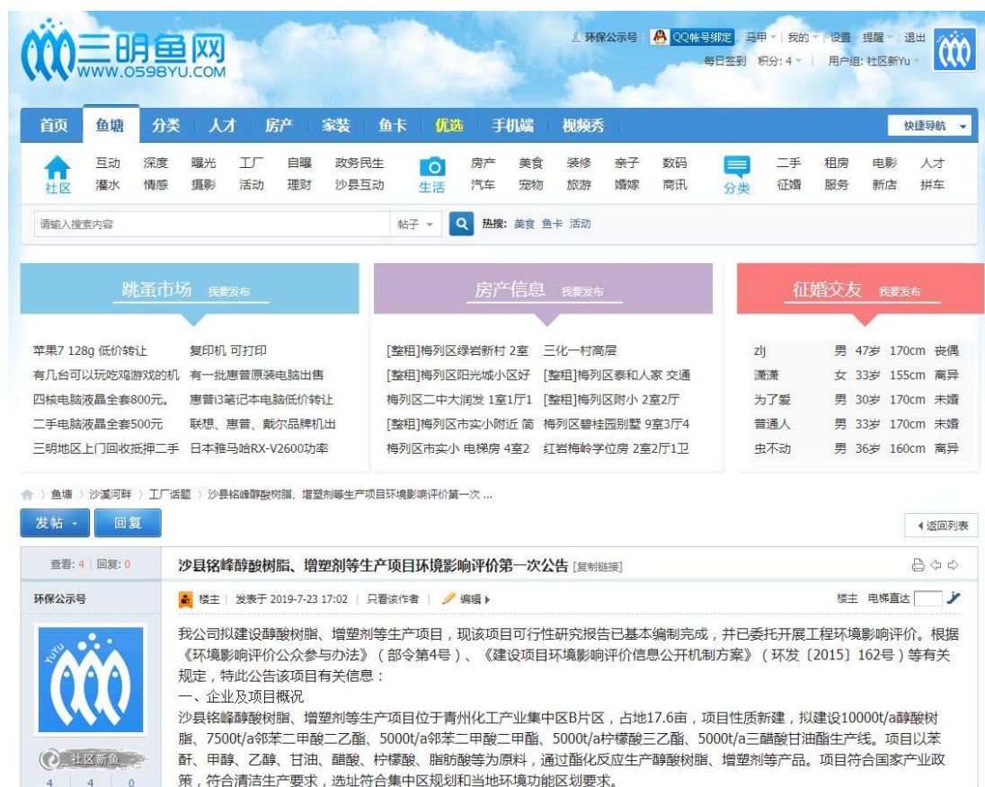
图 2-1-2 首次环境影响评价信息网络公开截图

首次环境影响评价信息公开在公司官方网站上进行, 公示起始时间为 2019 年 7 月 23 日至 2019 年 8 月 6 日, 首次环境影响评价信息公开公告登入网址: http://bbs.0598yu.com/forum.php?mod=viewthread&tid=591962&extra=page%3D1 , 截图见图 2-1-2。