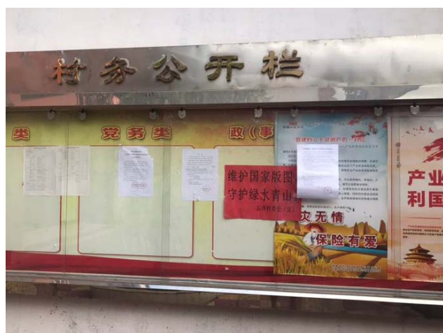
后洋新村公告栏公告远景