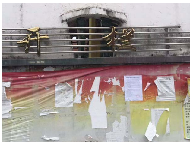
青州镇公告栏公告远景

境影响评价报告书征求意见稿公示公告选择的张贴地点合理。公告时间为 2019 年 9 月 9 日至 2019 年 9 月 24 日，公告图片详见图 3-2-4。