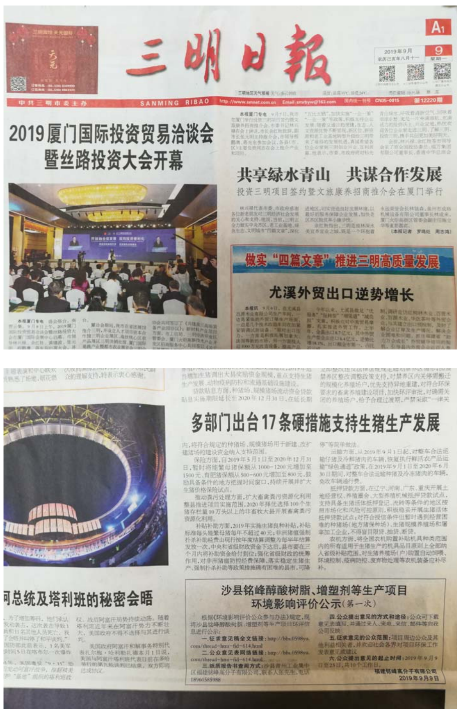
图 3-2-2 三明日报 2019 年 9 月 9 日公告

公司分别在2019年9月9日的《三明日报》（第12220，B4版）和2019年9月11日的《三明日报》（第12222，B4版）发布项目环境影响报告书征求意见稿公示公告，详见图3-2-2、3-2-3。