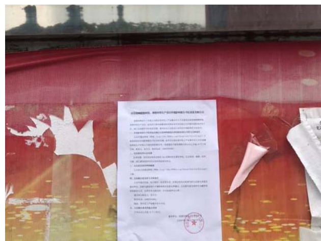
青州镇公告栏公告近景