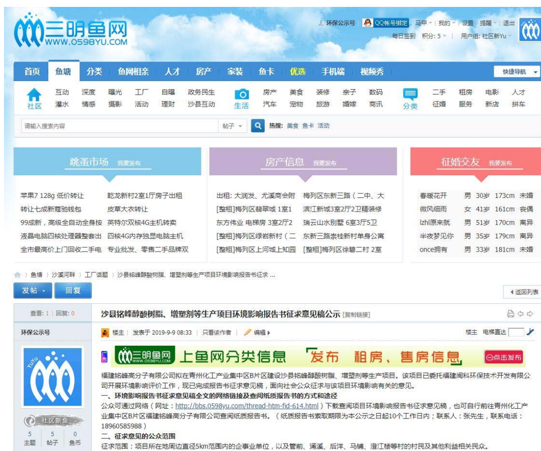
图 3-2-1 环境影响报告书征求意见稿网络公示截图

项目环境影响报告书征求意见稿公示在三明鱼网上进行, 公示起始时间为 2019 年 9 月 9 日至 2019 年 9 月 24 日, 环境影响报告书征求意见稿公示登入网址: http://bbs.0598yu.com/forum.php?mod=viewthread&tid=593851 , 截图见图 3-2-1。