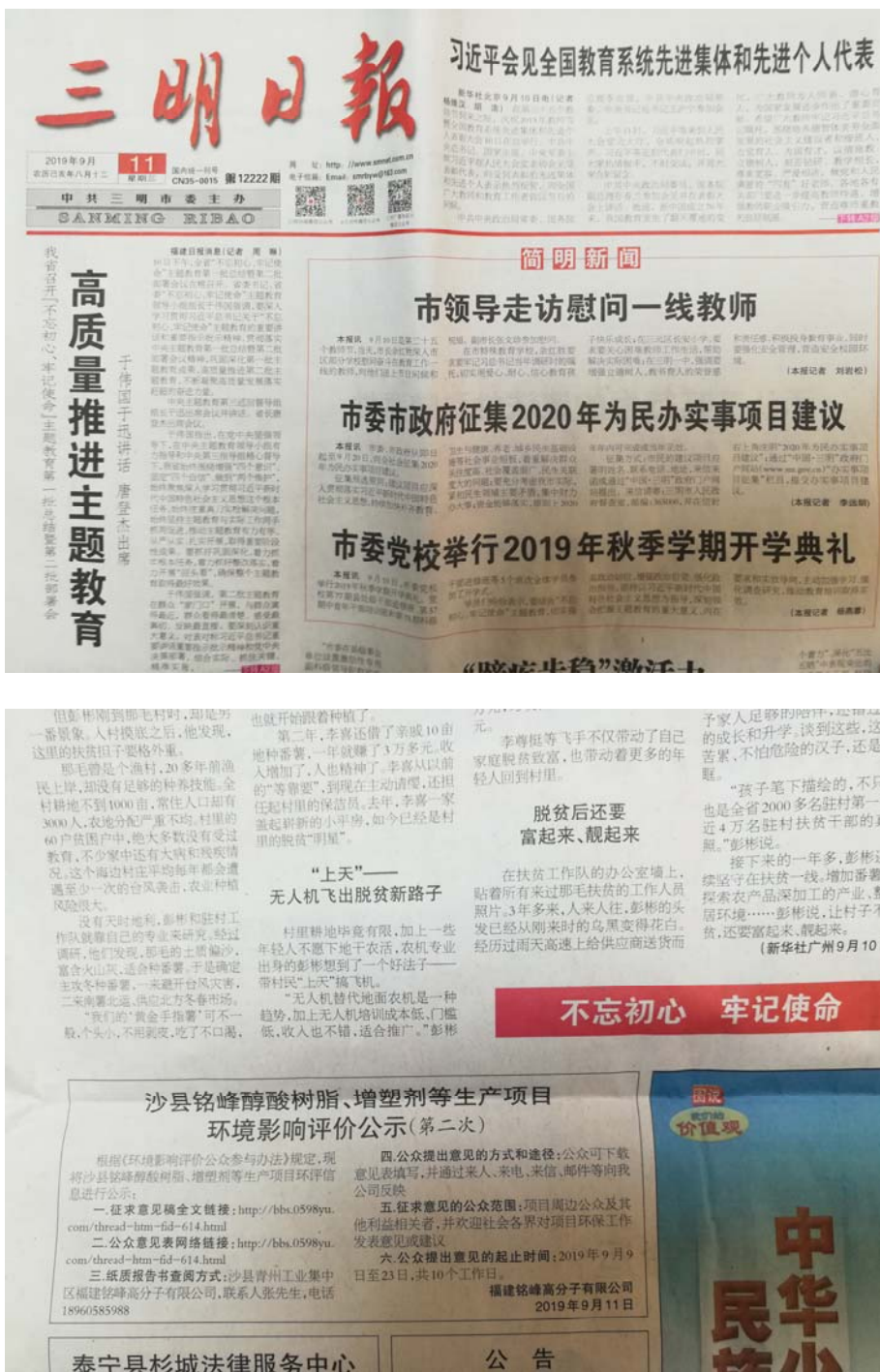
图 3-2-3 三明日报 2019 年 9 月 11 日公告