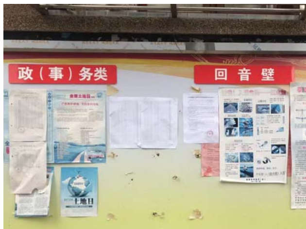
管前村公告栏公告远景